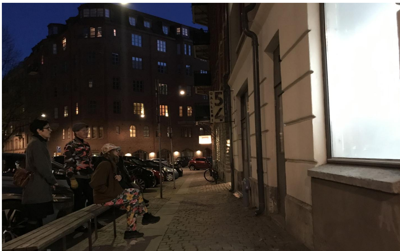
Efter mörkrets inbrott.